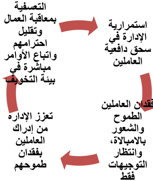
شكل (٢) محددات نظام المناعة التنظيمية